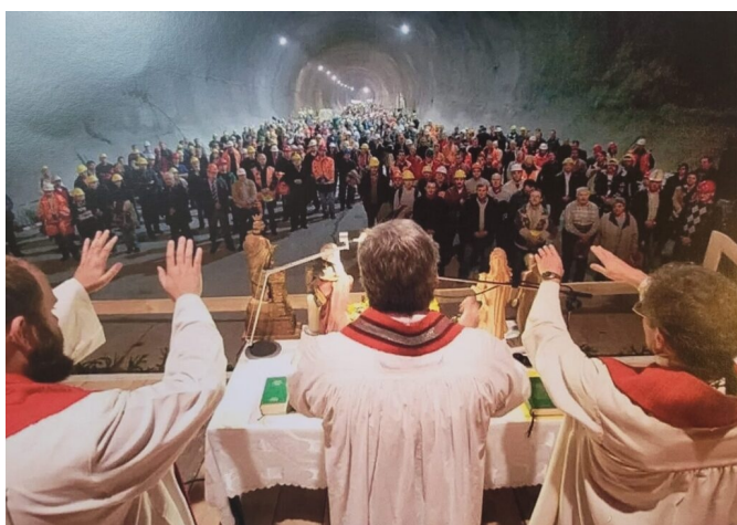
Messe d'inauguration dans le tunnel de base du Gothard. Ici lors d'une cérémonie en l'honneur de sainte Barbe, la patronne des mineurs en 2016.

Il revient sur l'inauguration du plus grand « tunnel de base » du monde (donc très bas en altitude), celui du Gothard en Suisse en 2016 qui fut suprahelvétique avec des bénédictions, des danseurs... parce que les Suisses voulaient bien montrer que ce tunnel qui traverse les Alpes leur appartenait. Si le tunnel Lyon-Turin voit le jour un jour, il sera aussi maximum à 500 mètres d'altitude. Le but ici est de « faire disparaître les Alpes ». Et on peut dire que les Alpes commencent là où on charge les camions au Sud près de la Plaine du Pô vers Milan et elles finissent à Anvers en Belgique pour transborder la