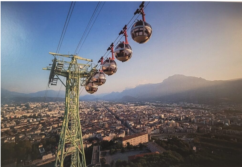
Le téléphérique de Grenoble Bastille inauguré en 1934

On surnomme Grenoble « Chicagre » pour l'associer à Chicago, ville polluée dans une cuvette en forme de Y entre le Vercors, Belledonne et la Chartreuse. De cette ville, on peut voir les Alpes comme « paysage » et c'est un point de vue pour aborder le massif. (Sachant qu'on ne peut plus voir les Alpes au delà de 350km). D'ailleurs, pour info, de Chamonix il n'est pas facile de voir le Mont Blanc .