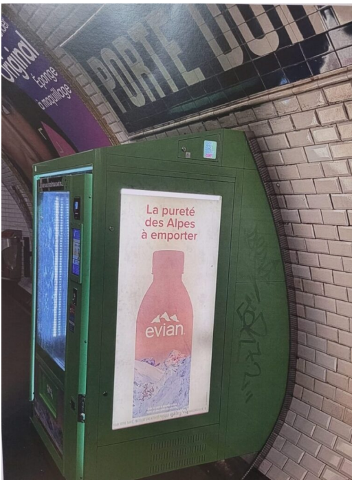
Une publicité d'Évian dans le métro parisien.