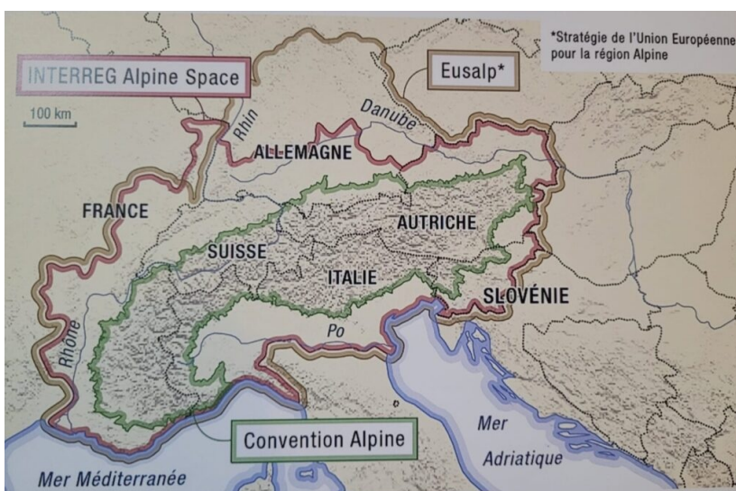
Carte politique provenant de « L'Atlas des Montagnes », 2024 de Xavier Bernier et Christophe Gauchon

Les délimitations politiques de cette carte montrent celles où s'appliquent les programmes Interreg (cadre de projets transnationaux), Eusalp (stratégie alpine de projet) et de la Convention Alpine de 1991 (avant la CIPRA qui protégeait les ressources des Alpes). Ces limites ne correspondent pas à des délimitations naturelles reconnues mais politiques, diverses et non unanimes. En France, on a des comités de massifs, les espaces protégés et