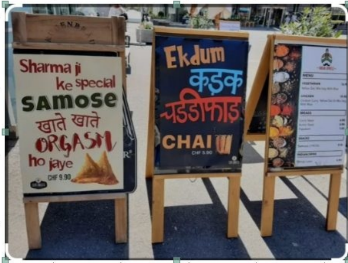
Devantures de restaurants indiens à Interlaken – Panneaux bilingues hindi-allemand

En revanche, les établissements de moyenne de gamme conservent les noms typiquement alpins : les Mélézes, Les chamois..