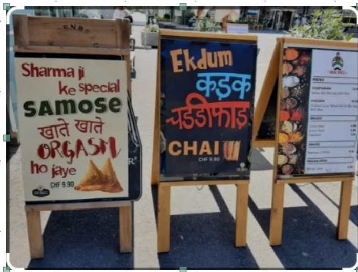
Devantures de restaurants indiens à Interlaken - Panneaux bilingues hindi-allemand

Les Alpes sont un peu partout : États-Unis, Japon, Australie, Scandinavie... et même sur la Lune ! Et puis, les JO d'hiver ne sont rien d'autre que l'exportation d'une idée alpine... dès 1932. Inversement, les Alpes accueillent le Monde : dans le massif, les noms de lieux évoquent le monde entier et reflètent le cosmopolitisme des touristes.