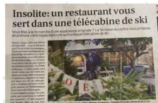
La dépêche du Midi 13/12/2021

Certaines activités réutilisent le matériel lié aux pratiques dans les Alpes pour leur marketing = exemple de l'utilisation d'anciennes télécabines dans des restaurants (Tarn et Garonne, Paris ou Dubaï).